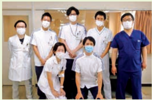
各職種の集合写真