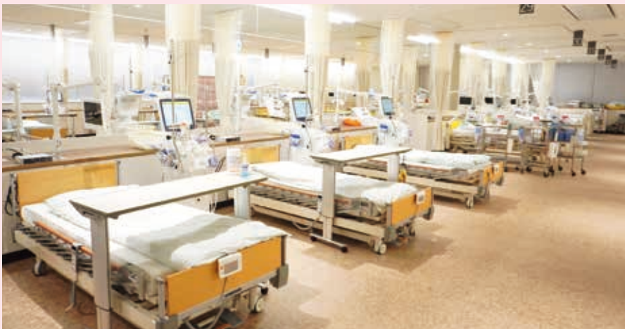
人工透析センター内観