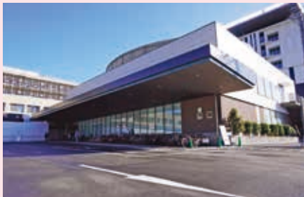
人工透析センター外観