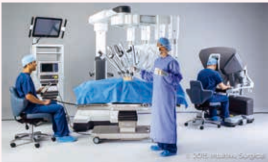
写真中央の鉗子が付いた機器を写真右の操縦席に座る医師が、カメラからの映像を見ながら操作して行います。写真左の画面に同じ映像が映り、情報を共有しています。

昨年度、ロボット支援下手術の保険適用が拡大したことを受け、当院では今年度から膀胱がん胃がん肺がんロボット支援下手術を始めました。今後も皆さんに、より良い医療を提供できるように、努めてまいります。