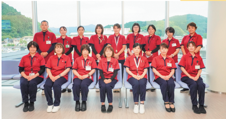
医師事務作業補助者スタッフの皆さん

随時スタッフの募集も行っています。 詳細は病院ホームページよりご確認ください。 医師事務作業補助者の募集詳細は、 下記のQRコードからご覧いただけます。